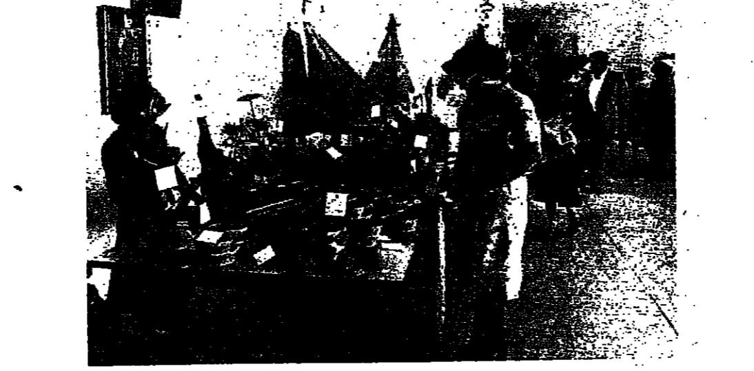
اشغال من القصب